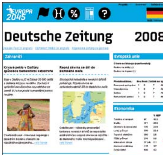
Evropa 2045: Novinové zprávy.

Po vyřešení problému se studenti budou věnovat ekonomickému řízení své země. Díky tomu, že je hra on-line, ji bude možné hrát i doma. Studenti se musí rozhodnout, jestli investují spíše do rozvoje ekonomiky, vědy a výzkumu, armády, kultury, zemědělství či